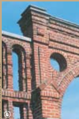
Ancienne filature Wignehies.

filature Prouvost-Masurel, il propose une rétrospective d'un siècle d'histoire locale et une reconstitution de la vie quotidienne à travers des lieux spécifiques comme l'estaminet, l'école ou les magasins, ainsi qu'une chaîne complète de machines à tisser et à filer. Huit autres annexes sont consacrées aux autres productions qui ont fait vivre l'Avesnois, pendant des siècles et même encore aujourd'hui. Le train de l'histoire industrielle est en marche et n'est pas prêt de s'arrêter !