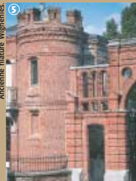
Ancienne filature Wignehies.

filature Prouvost-Masurel, il propose une rétrospective d'un siècle d'histoire locale et une reconstitution de la vie quotidienne à travers des lieux spécifiques comme l'estaminet, l'école ou les magasins, ainsi qu'une chaîne complète de machines à tisser et à filer. Huit autres annexes sont consacrées aux autres productions qui ont fait vivre l'Avesnois, pendant des siècles et même encore aujourd'hui. Le train de l'histoire industrielle est en marche et n'est pas prêt de s'arrêter !