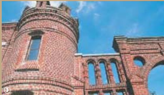
Ancienne filature Wignehies.

son apogée et parallèlement fleurissent dans la ville les grandes propriétés bourgeoises des fabricants, bonnetiers et manufacturiers. En excellent état, certaines remplissent aujourd'hui d'autres fonctions, équivalentes à leur standing, tel qu'hôtel de ville. Pour s'immerger davantage dans l'histoire de l'industrie textile, rien ne vaut une visite à l'écomusée de Fourmies. Installé dans l'ancienne