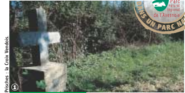
Prisches - La Croix Vendois.

Randonnée Pédestre Circuit des boutons d'or : 8 km