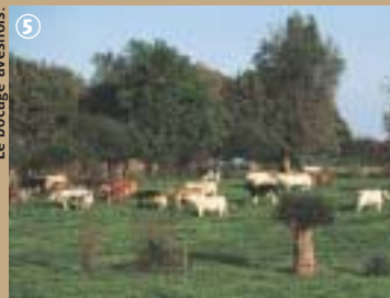
Le bocage avesnois.

milieu rural composé essentiellement de pâturages, enclos par des haies champêtres. Ce système favorise la prolifération d'une végétation herbacée et arbustive qui fait le régal de la faune sauvage comme domestique, à commencer par les bovins. Mais les oiseaux, comme le Rouge-gorge ou les mésanges ne sont pas en reste et trouvent dans ces « clôtures » d'aubépines ou églantiers un lieu de résidence et de sustentation idéal.