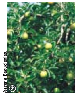
Verger à Beaudignies