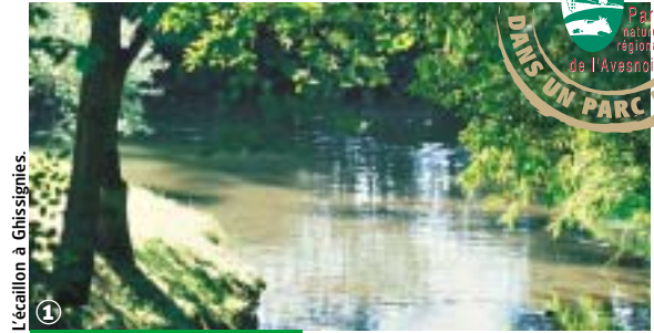
L'écaillon à Ghissignies

Bavais, Pays Quercitain, forêt de Mormal, 2000 ans d'histoire à contempler