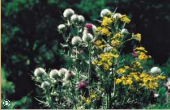
Chardons et Sénéçon

la tombée de la nuit qu'il envire les haies et lisières forestières de son parfum frais et délicat. Il a mauvaise réputation et pourtant que de qualités cache le pissenlit : il s'uti-