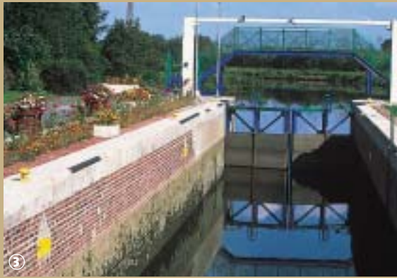
Ecluse de Sassegnies

L'Avesnois est un territoire où les ressources naturelles sont aussi visibles dans l'architecture que dans l'activité des hommes. Héritiers d'un savoir-faire légué par tradition et par des générations d'artisans, ses habitants ont su extraire le meilleur des matériaux naturels, en développant des talents et des métiers. De multiples espaces forestiers y sont répartis et, en l'occurrence, la forêt la plus importante du département : la forêt de Mormal.