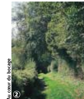
Au cœur du bocage

Ce circuit relie la Sambre champêtre à la forêt domaniale de Mormal et traverse entre deux la ceinture bocagère. Elle emprunte donc divers chemins et routes et traverse un paysage varié. Le patrimoine naturel et fluvial anime une grande partie du parcours.