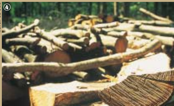
Travail du bois

Le musée des bois jolis de Felleries ainsi que des ateliers d'artistes vous ouvrent leurs portes et vous invitent à découvrir bois tournés, à Leval et à Felleries, ébénisterie et antiquités à Bersillies, sculpture à Recquignies, dans la douce odeur du bois qui se métamorphose, sans oublier le facteur d'orgues de Berlaimont ! Laissez-vous séduire par le savoir-faire, l'ingéniosité de l'outil, la beauté et la magie des gestes, qui avaient, et ont encore en commun, d'être faits avec ardeur et courage, donnant ainsi tout son sens à l'expression du bel ouvrage.