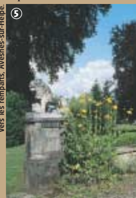
Vers les remparts, Avesnes-sur-Helpe.

aujourd'hui le Géant de la ville. Est-ce parce qu'elle recèle d'autres trésors architecturaux, comme sa grand place, ses grimpettes, sa superbe collégiale et son carillon qu'elle est si remarquable ? Ou, comme le prétendait Vincent Van Gogh, parce qu'Avesnes-sur-Helpe se situe en Avesnois « [un] pays aussi pittoresque que le Vieux Venise, que l'Arabie, la Bretagne, la Normandie ou la Brie ». Jugez-en par vous-même !