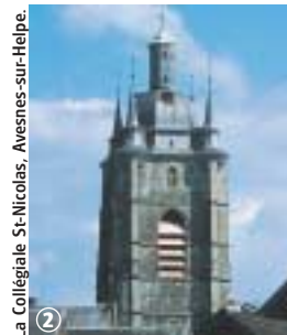
La Collégiale St-Nicolas, Avesnes-sur-Helpe.

L'avis du randonneur : Parcours accessible toute l'année dans le Pays d'Avesnes. Le circuit de 3,7 km s'adresse aux familles. Soyez prudent le long de la RD 133. En période de pluie, le port de chaussures étanches est nécessaire.