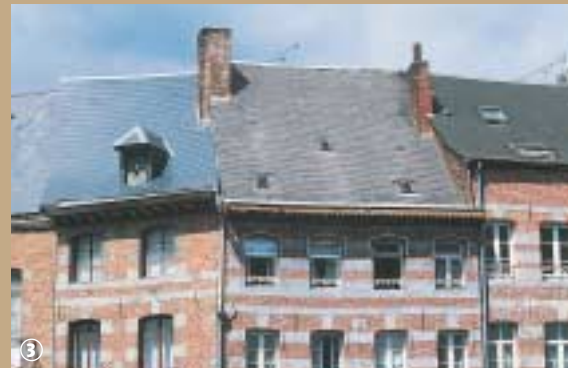
Hôtel de Ville, Avesnes-sur-Helpe.