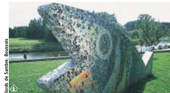
Bords de Sambre, Boussois

Rédactrice : Fanny Fouquet - Création : Penze Edition - Lille