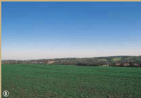
Plateau du Hainaut-Wallon

Petit village du Hainaut Wallon, Vieux-Reng possède, outre sa chapelle en pierre bleue et briques et son kiosque à musique de 1925, une église du XVII e siècle.