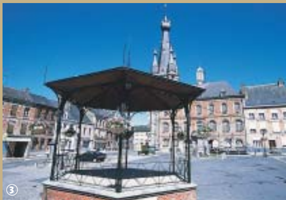
Grand-Place, Solre le Château

Solrines et Solre-le-Château doivent toutes deux leur nom au cours d'eau qui les traverse : la Solre, très appréciée des pêcheurs. Cette rivière, affluent de la Sambre, fut à l'origine du développement économique de ces communes, car les industries du cuir, du textile, les forges ou les brasseries utilisèrent l'énergie hydraulique fournie par la Solre pour fonctionner. Aussi, de nombreux moulins implantés le long de son cours, utilisaient l'eau