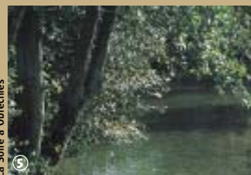
La Solre à Obrechies

comme force mécanique, et la roue du moulin entraînait le tout. Le moulin de Reumont, à Solrines, a fait récemment l'objet d'une restauration. Il appartenait à l'Abbaye de Liessies et les moines d'Aulnes venaient y faire retraite. Solre-le-Château possède un musée de la Boissellerie aménagé dans un moulin à eau du XV e siècle restauré. Pour compléter ce patrimoine