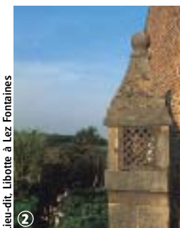
Lieu-dit, Libotte à Lez Fontaines

Promenade vallonnée à travers les bois et les bocages de l'Avesnois, qui traverse des villages typiques avec leurs coquettes maisons de pierres bleues et de briques, leur kiosque et leurs petites chapelles. De bonnes chaussures sont nécessaires. En période de chasse (calendrier en mairie), emprunter la variante indiquée. Le parcours de 6 km est particulièrement adapté aux familles. Prudence dans la traversée des RD 27 et 962.