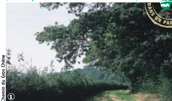
Chemin du Gros Chêne