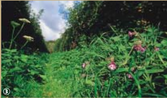
« caches » et fleurs champêtres.

C'est un fait acquis dans la commune, comme en témoignent la statue érigée sur la place et les nombreuses enseignes à ce nom, Poix-du-Nord est fier de compter parmi ses illustres représentants le tragédien Talma. Pourtant – au risque de s'octroyer les foudres des Podéens – l'enfant du pays est