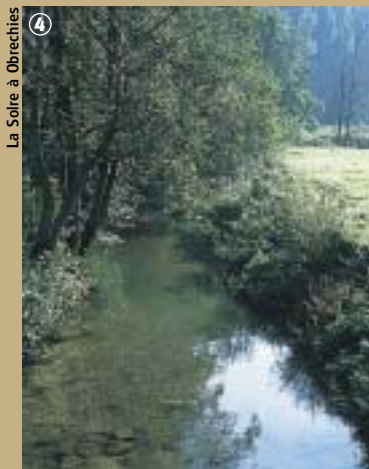
La Solre à Obrechies

Avec pour objectifs de réconcilier la population citadine avec des milieux ruraux et naturels de qualité et d'inciter les pouvoirs publics à mieux connaître le patrimoine naturel du pays, Natura 2000 reste une étape nécessaire