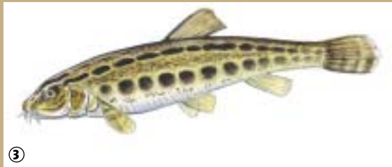
Loche de rivière

Les vallées de la Solre, de la Thure et de la Hante sont parcourues de cours d'eau à fond sablo-vaseux dans lesquels vit, près des rives, la Loche de rivière.