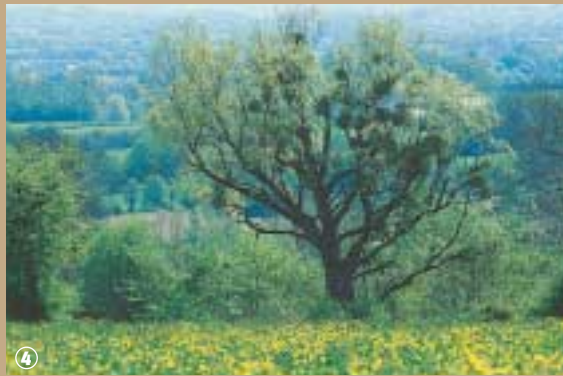
Bocage à perte de vue.

temps marqué la frontière entre les Pays-Bas espagnols et la France ; aujourd'hui encore, il demeure le dernier village du département du Nord à la frontière du département de l'Aisne.