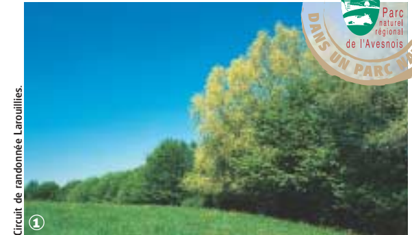
Circuit de randonnée Larouillies.