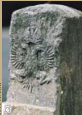
Borne frontière. ④

Brunehaut périt attachée à la queue d'un cheval lancé au galop. Certains historiens supposent que l'homme du Moyen Age, impressionné par ces chaussées rectilignes, y aurait vu l'œuvre du Diable ou l'œuvre de Brunehaut. Certains y voient une postérité reconnaissante envers cette reine qui aurait fait restaurée la chaussée suite aux invasions barbares ; d'autres, parce qu'elle fut le lieu de martyr de l'infortunée souveraine.