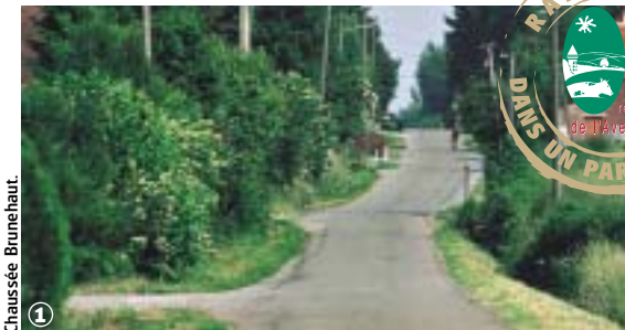
Chaussée Brunehaut. ①

Bavais, Pays Quercitain, forêt de Mormal, 2000 ans d'histoire à contempler