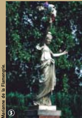
Marianne de la Flamengrie. ③

La commune est également traversée par l'une des voies romaines qui reliait Bavay à Tournai. Sous la