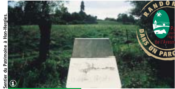
Sentier du Patrimoine à Hon-Hergies.

Bavais, Pays Quercitain, forêt de Mormal, 2000 ans d'histoire à contempler