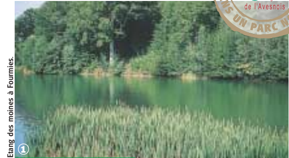
Etang des moines à Fourmies.

Randonnée Pédestre Les étangs des Moines : 4 km