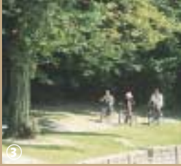
Etang des moines à Fourmies.

En Avesnois, nature et industrie sont intimement liées. Si le sol possède des richesses, encore faut-il pouvoir les exploiter. Si le paysage se révèle un obstacle, l'homme finit toujours par le surmonter. A l'image de ce constat, le site des Etangs des Moines honore d'une certaine façon, ces hommes d'église qui contribuèrent au développement de l'industrie métallurgique dans ce coin du département, en maîtrisant l'eau.