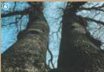
Les Chênes jumelés.

Aujourd'hui la nature a repris ses droits. Les Etangs des Moines sont devenus un lieu de détente et de loisirs. Des plaines de jeux sont installées pour les enfants. Profitez d'une balade à pied, à cheval ou en VTT, pour découvrir, dans le massif au cœur de la forêt domaniale de Fourmies, deux chênes plusieurs fois centenaires ; nommés « les Jumelles », ils ont une particularité : ils sont siamois ! Encore une farce de la nature... !