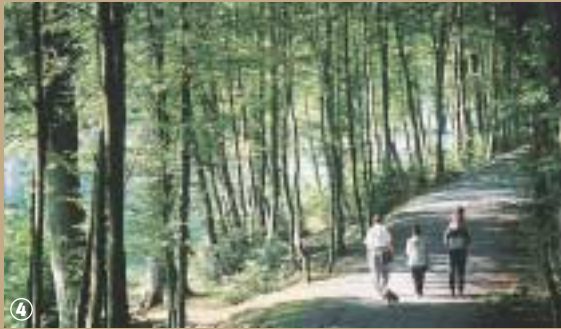
Etang des moines à Fourmies.

également une chapelle « Notre Dame du Bois », dédiée à la Vierge.