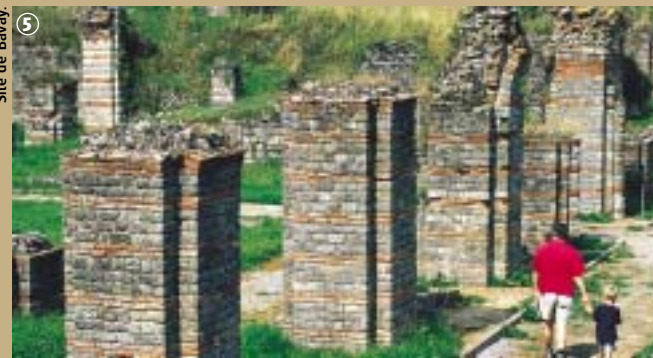
Site de Bavay

politique, judiciaire et militaire, puis prend une place commerciale de première importance dès le I er siècle après J-C. De vastes monuments sont construits : un forum, centre de la cité gallo-romaine et symbole de la puissance romaine ; des thermes alimentés par un aqueduc amenant les eaux d'une fontaine située à une vingtaine de kilomètres et d'autres bâtiments ornementaux. Le forum est l'un des plus grands de ce type connu actuellement en Gaule alors que Bavay est l'un des chefs-lieux de cités les plus modestes du territoire. Avec les troubles du Bas-Empire, Bavay perdit son rôle de capitale au profit de Cambrai et ne résista pas aux invasions barbares des III e et IV e siècles. Le musée archéologique abrite une impressionnante collection de bronze ainsi que des poteries, céramiques, verreries. Chaque premier week-end de juillet, les années paires, ont lieu les fêtes gallo-romaines.