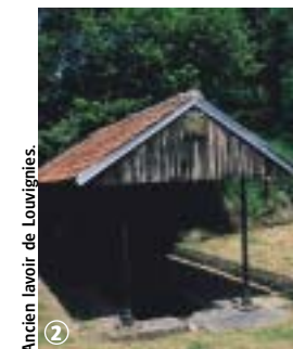
Ancien lavoir de Louvignies.