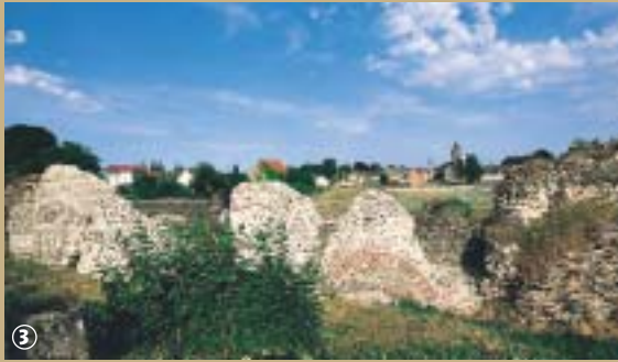
Site de Bavay

Quand une histoire en chasse une autre... quelle ironie du sort que les faits qui se produisirent à Bavay le 17 mai 1940 : la commune est alors en proie à de violents bombardements aériens qui mettent à jour des restes de la cité antique.