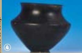
Musée de Bavay

Quand une histoire en chasse une autre... quelle ironie du sort que les faits qui se produisirent à Bavay le 17 mai 1940 : la commune est alors en proie à de violents bombardements aériens qui mettent à jour des restes de la cité antique.