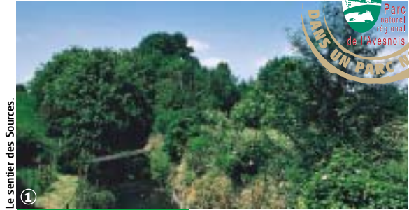
Le sentier des Sources.

Randonnée Pédestre Sentier des Sources : 4 km